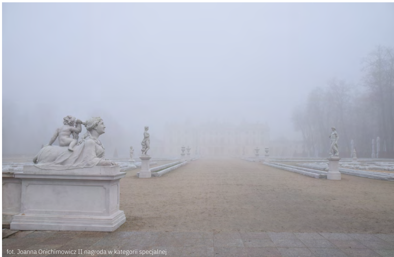
II nagroda w kategorii specjalnej

nych, wykładowca fotografii z kilkunastoletnim doświadczeniem;